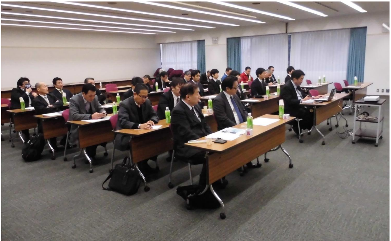
あっという間に満員