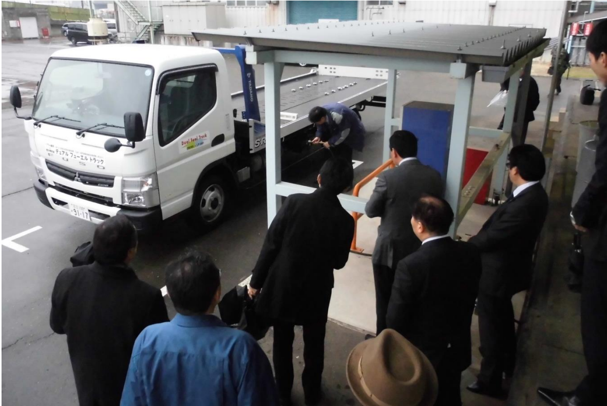
LPガスの充填を見せた