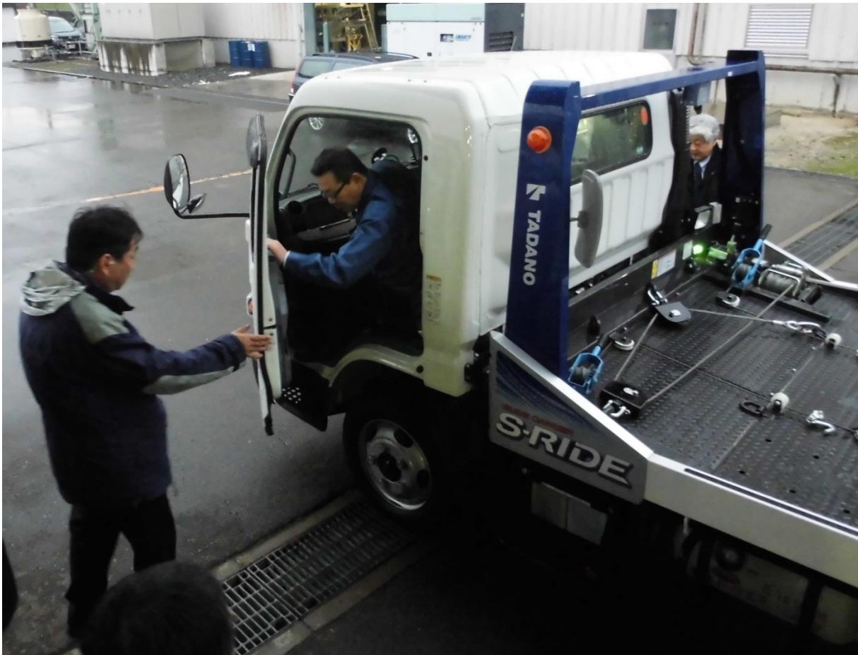
トラックのダッシュボードもしっかり拝見